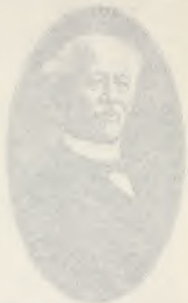
Portrait of [Name] [Title]